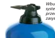
Wbudowany by-pass: system włączania (on) i przerywania (off) zasysania preparatu.

Opcje pozwalają dostosować dozownik do konkretnych potrzeb. Ich użyteczność należy określić wspólnie z naszymi służbami technicznymi.