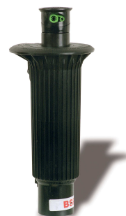
12 zraszaczy EAGLE 950-E