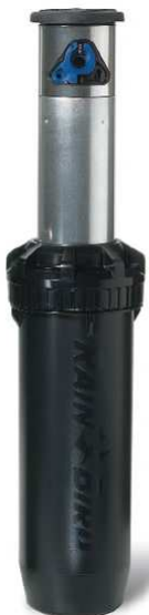
24 zraszacze Falcon 6504 - SS