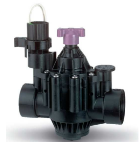
3 zawory 1.5" PGA