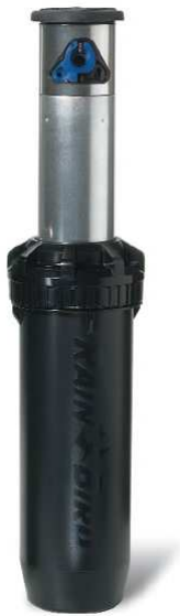
6 zraszaczy Falcon 6504 PC SS HS