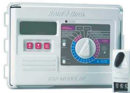
Sterownik ESP Modular